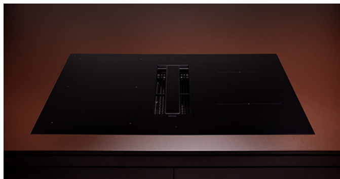
Fotografija je isključivo informativnog karaktera Možda neće odgovarati odabranoj verziji.